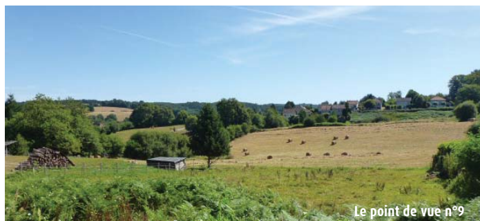
Le point de vue n°9