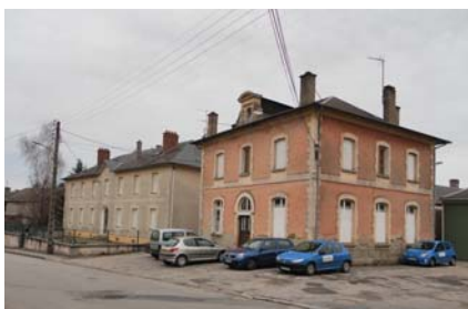
L'ancienne école de filles et l'ancienne gendarmerie

14 L'ancienne école de filles (en rose) et l'ancienne gendarmerie.